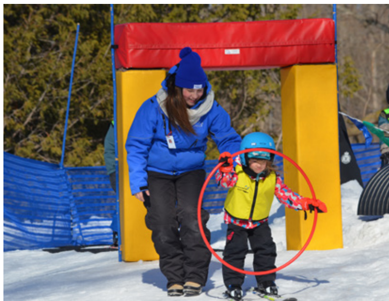
Site Expérience maneige de Québec

Malgré la réduction du nombre total de sites Expérience maneige, le nombre d'initiations est semblable à l'année dernière.